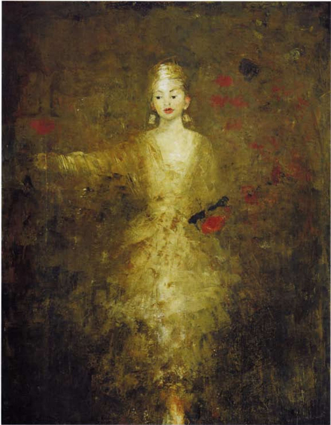
The girl with the perle, 116 x 89 cm, huile et cire sur toile, 2009

«Ses peintures ne sont pas, à proprement parler, murales. Elle travaille sur des toiles accrochées au mur de l'atelier, et à l'aide de techniques qu'elle a elle-même mises au point, en utilisant une certaine cire mêlée à la peinture à l'huile, elles donnent cette impression de fresque. Elles sont leur propre mur.»