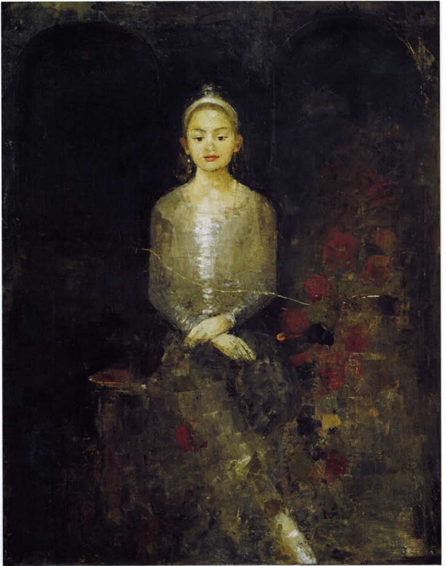
Under the arches, 146 x 114 cm, huile et cire sur toile, 2009