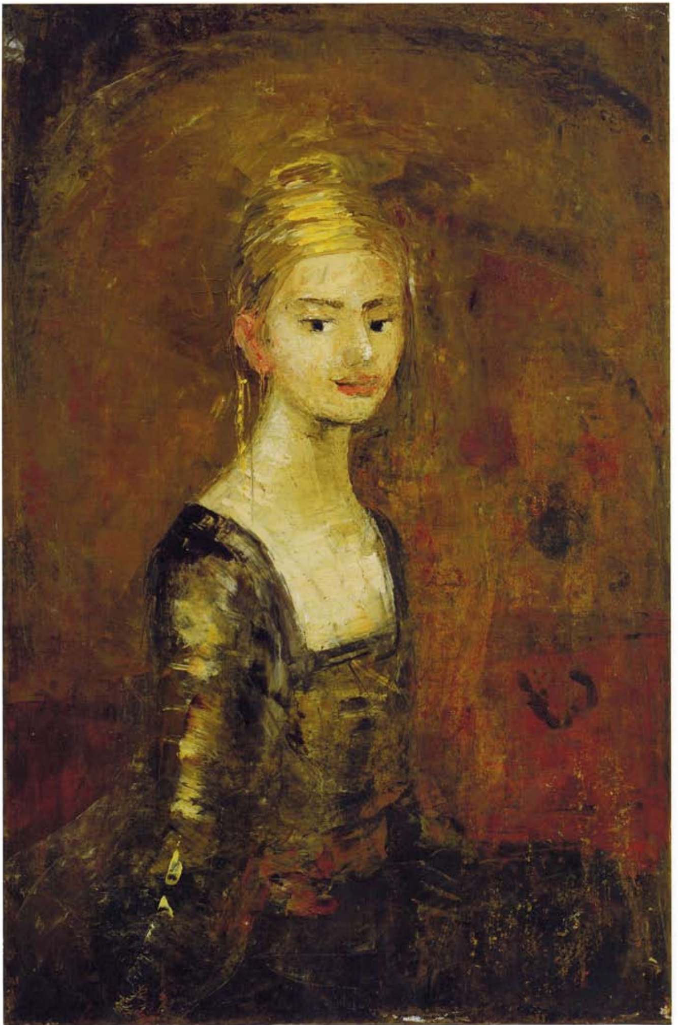
Noblesse, huile et cire sur toile, 2009