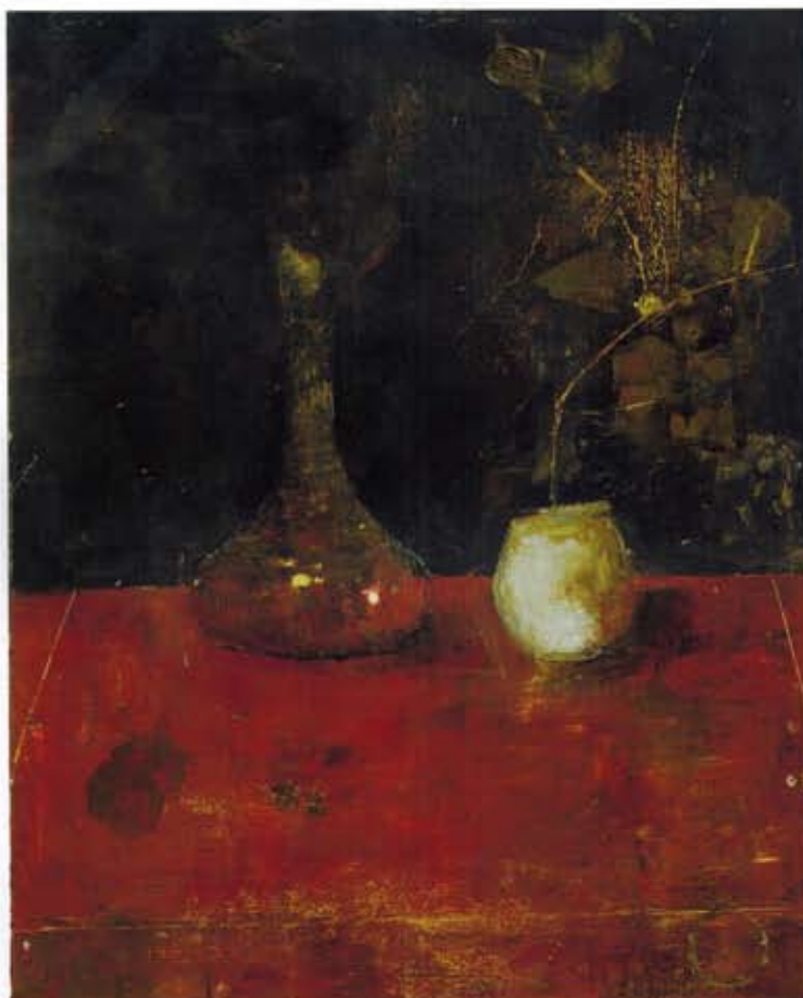
Red cloth, 81 x 65 cm, huile et cire sur toile, 2009